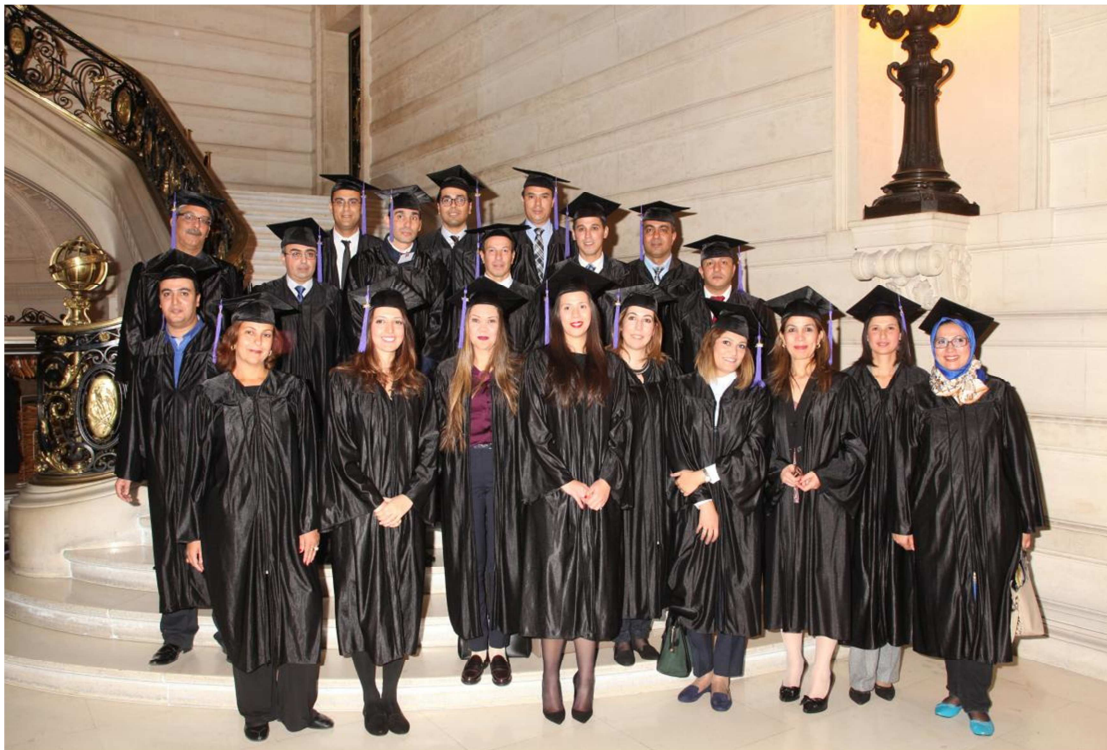
Promotion 2015 MBA IAE Paris-Dauphine, centre de Tunis