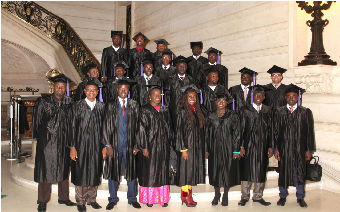
Promotion 2015 MBA IAE Paris – Dauphine, centre de Dakar ( CESAG )